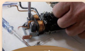
銅線ケーブル分別